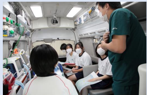
<救急車(病院救命士)>