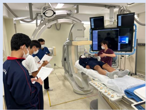
<血管造影室(放射線部)>

5月には新型コロナウイルス感染症が5類となり、これまで自粛されていたイベントも徐々に再開され、以前のような活気が戻りつつあります。当院でも感染対策に配慮しながら、地域の皆様とのつながりを大切にしていまいります。